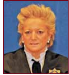
Mª Luisa Segoviano Astaburuaga Magistrada sala IV del Tribunal Supremo