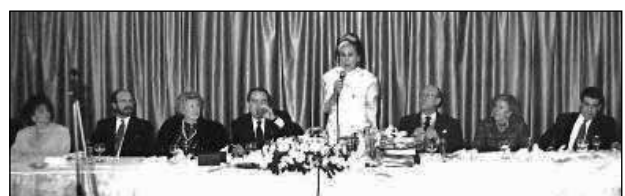
Cena Homenaje nombramiento Presidenta de Honor, 11 de julio de 1985